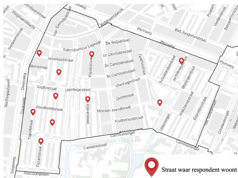
Afbeelding 2: Spreiding respondenten in Carnisse 1